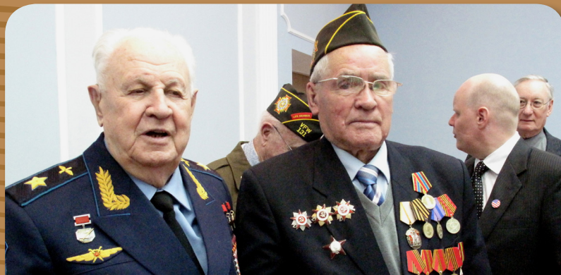
Ветеран Великой Отечественной войны, доктор экономических наук, профессор (на встрече с ветеранами войны)

В 1946 г. после демобилизации был студентом, затем аспирантом Московской сельскохозяйственной академии им. К.А.Тимирязева. Успешно защитил кандидатскую и докторскую дис-