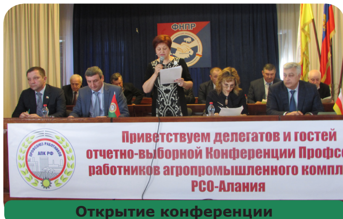
Приветствуем делегатов и гостей отчетно-выборной Конференции Профсоюза работников агропромышленного комплекса РСО-Алания

Вопросы, касающиеся охраны труда, постоянно становились предметом серьезного обсуждения на заседаниях президиума и рескома Профсоюза. За отчетный период в первичных профсоюзных организациях проводились