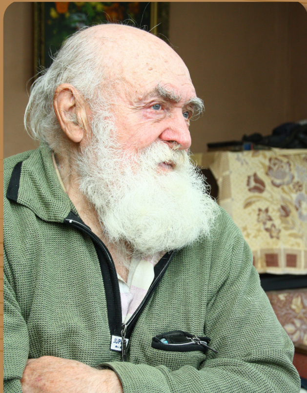
Ветеран Великой Отечественной войны, ветеран государственной ветеринарной службы города Москвы