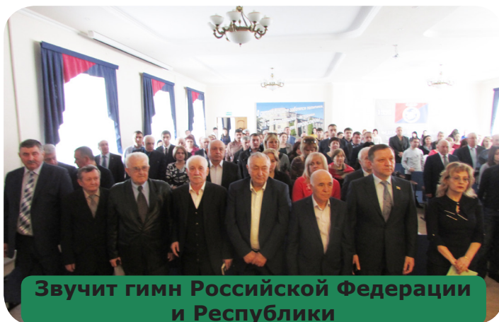
Звучит гимн Российской Федерации и Республики

Проводилась целенаправленная работа по организационному укреплению. По сравнению с 2013 годом, рост профсоюзной численности составил 2,1%, в состав республиканской организации входят 67 первичных профсоюзных организаций (в 2013 году - 64 первички). Особое внимание уделяется укреплению кадров, созданию кадрового резерва в первичных профсоюзных организациях, обучению профсоюзного актива. Вновь избранные члены профкомов