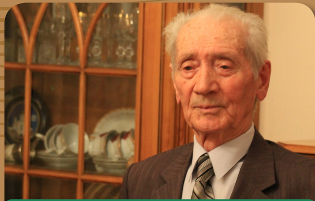
Гвардии старший лейтенант, командир стрелкового взвода 206 гвардейского стрелкового полка

Далее были годы работы и учебы. В 1954 году окончил Горский сельскохозяйственный институт (ныне Горский агроуниверситет), затем работал агрономом в колхозе им. Молотова и агрономом-семеноводом и пред-