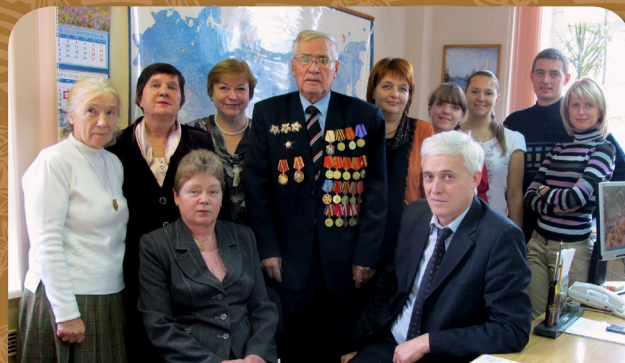
В окружении коллег по работе