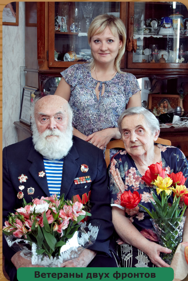
Ветераны двух фронтов